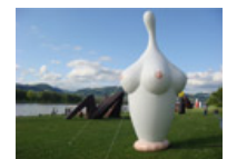
"AirWorks", Open-Air- Ausstellung in den Donau-Auen, Linz