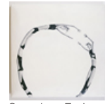
Sammlung Essl, Klosterneuburg