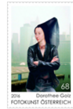
Sonderbriefmarke Fotokunst Österreich 2016