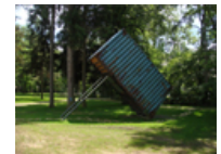
Memorial, IST, Gugging bei Wien