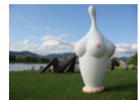
"AirWorks", Open-Air- Ausstellung in den Donau-Auen, Linz