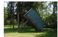
Memorial, IST, Gugging bei Wien