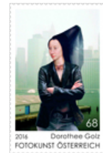
Sonderbriefmarke Fotokunst Österreich 2016