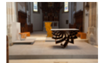
Liturgische Objekte für die Pfarrkirche in Wartberg ob der Aist, Österreich