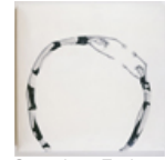
Sammlung Essl, Klosterneuburg