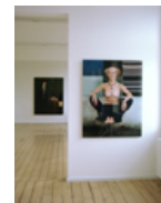
Galerie Frank Schlag, Essen