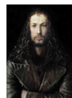
"Porträt. Sehnsucht nach dem Abbild" Kunsthalle Krems